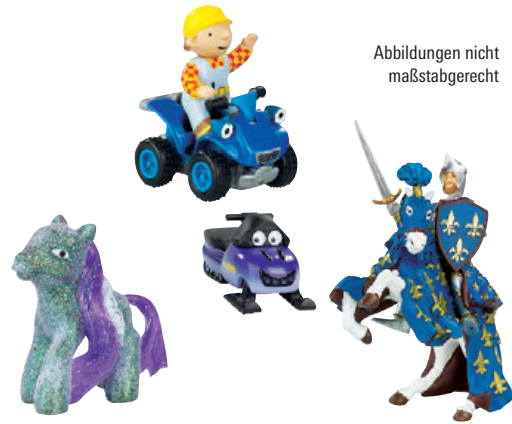
Abbildungen nicht maßstabgerecht