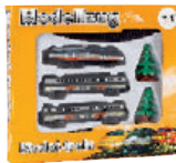
Abbildungen nicht maßstabgerecht