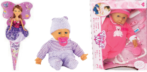
Abbildungen nicht maßstabgerecht