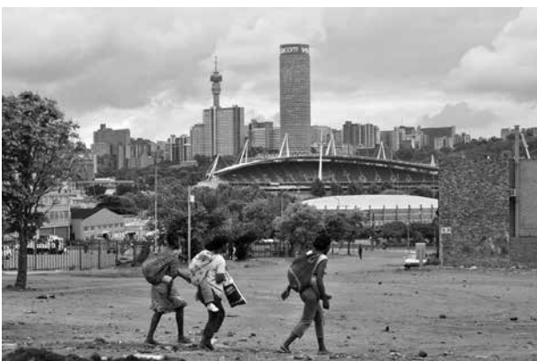
Als Ausrichter der Fußball-WM 2010 sollte Südafrika von den Erfahrungen der Fußball-WM 2006 in Deutschland profitieren

Der Erfolg der deutschen WM 2006 basierte zum Großteil auf den von der Außenwelt kaum wahrgenommenen Anstrengungen der WM-Austragungs- und Teamstädte: Verkehrslenkung, Stadienbau und -sicherheit, Fanmeilen, das Umweltprogramm „Green-Goal“, Marketing und die Zusammenarbeit mit den Tourismusverbänden – all das und vieles mehr hatte den glanzvollen Auftritt der WM überhaupt erst ermöglicht.