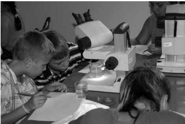
Kinder untersuchen Wasserproben im „Grünen Klassenzimmer“, einem offiziellen Projekt der UN-Dekade „Bildung für nachhaltige Entwicklung“ in Bad Rappenau

Für eine Auszeichnung als Stadt, Gemeinde oder Landkreis der Weltdekade „Bildung für nachhaltige Entwicklung“ müssen die Aktivitäten Ihrer Kommune bezüglich der genannten Kriterien im Vergleich mit anderen Kommunen stark überdurchschnittlich ausfallen.