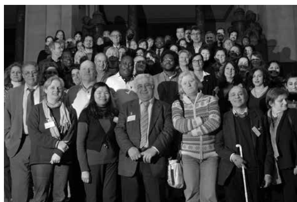
Die Servicestelle Kommunen in der Einen Welt fördert die Vernetzung von Entwicklung und Migration durch einen bundesweiten Erfahrungsaustausch

Die Servicestelle Kommunen in der Einen Welt (SKEW) hat 2011 das bundesweite Netzwerk „Migration und Entwicklung“ ins Leben gerufen. Das Netzwerk ist ein wichtiges Instrument zum bundesweiten Erfahrungsaustausch und der Vernetzung von Entwicklung und Migration für die lokale Ebene. Es bringt Akteure aus Kommunalverwaltung und Zivilgesellschaft miteinander ins Gespräch und bietet ihnen ein Forum für einen kollegialen Austausch zu praxistauglichen Ideen, Handlungsansätzen und Projekten. Im Sinne einer Lerngemeinschaft werden neben guten Beispielen auch Hürden in der Alltagspraxis und erfolgreiche Ansätze zur Problemlösung diskutiert. Auch Schnittstellen zur staatlichen Entwicklungszusammenarbeit und zur Arbeit anderer maßgeblicher Akteure werden aufgezeigt. Darüber hinaus stellt die SKEW der kommunalen Ebene Informationen zu relevanten Erfahrungen, Beispielen und Akteuren zur Verfügung. Sie bietet kostenlose Beratung und Qualifizierung an. www.service-eine-welt.de/interkultur/interkultur-start.html