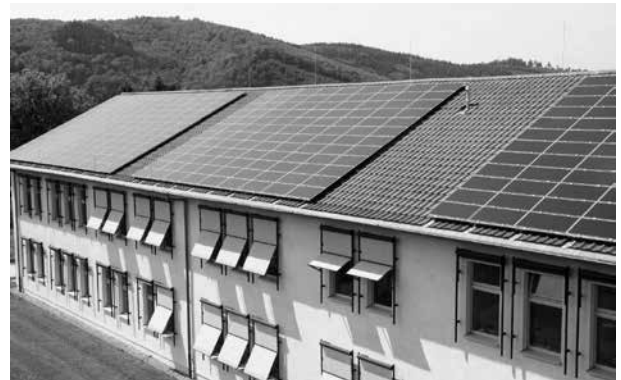
Die verstärkte Nutzung erneuerbare Energien trägt wesentlich zum Klimaschutz bei - Foto: Klaus Reuter / LAG 21 NRW

Städte sind Mitverursacher des Klimawandels. Städtische Ballungsräume haben einen hohen Energieverbrauch und auch die kommunale Daseinsvorsorge ist eng mit der Nutzung und dem Verbrauch von Ressourcen verknüpft. Gleichzeitig sind die kommunalen Aufgabenfelder wie Flächenmanagement, Landnutzungsplanung, Bebauungsplanung oder Abfallmanagement äußerst relevant für den Klimaschutz. In den Städten liegt damit auch ein erhebliches Potenzial für Energieeinsparung und Effizienzsteigerung.