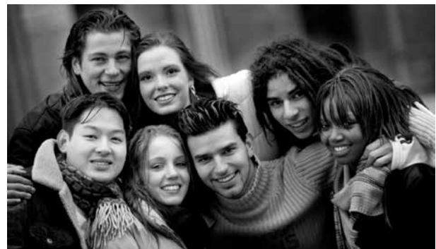
Etwa ein Fünftel der in Deutschland lebenden Menschen sind zugewandert oder Nachkommen von Zuwanderern

Migranten sind „Experten zwischen den Welten“. Schon aufgrund ihrer Biografie können sie als Vermittler, Berater und Experte vor Ort dienen. Dies kommt den Migrantenorganisationen zugute, denn diese unterhalten vielfältige Beziehungen zu ihren Herkunftsländern. Das Engagement der Diaspora zielt unter anderem auf so unterschiedliche Bereiche wie Bildung, Gesundheitswesen, „Community Empowerment“, Wirtschaftsförderung, Friedensarbeit, Umweltschutz, Antikorruption und Infrastruktur. Sie unterstützen etwa Initiativen von dörflichen Vereinigungen im Bereich Gesundheit oder Bildung, regen neue Ideen im Bereich Ausbildung oder Umweltschutz an oder verschreiben sich bestimmten professionellen Zielen, wie dem Transfer von Know-how auf Hochschulebene. 68 Daraus ergeben sich viele gemeinsame Ziele mit der deutschen Entwicklungszusammenarbeit, allen voran das Ziel der Armutsbekämpfung.