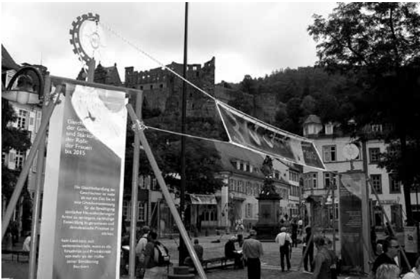
Viele Städte und Gemeinden in Deutschland setzen sich für die Verwirklichung der Millennium-Entwicklungsziele der Vereinten Nationen ein

ihre internationalen Verbände und Netzwerke – allen voran durch den Weltverband der Kommunen (United Cities and Local Governments/UCLG) – ihre eigene Stimme und Perspektive auf die globalen Entwicklungsherausforderungen in die internationalen Diskussionen auf UN- und Weltbank-Ebene eingebracht.