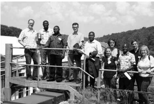
Im Rahmen des Projekts „50 Kommunale Klimapartnerschaften bis 2015“ entwickeln deutsche Kommunen mit Kommunen in Entwicklungs- und Schwellenländern gemeinsame Handlungsprogramme zum Klimaschutz und zur Klimaanpassung

Die Landesarbeitsgemeinschaft Agenda 21 NRW e.V. (LAG 21 NRW) hat in der Broschüre „Ideenheft: Bildungsnetzwerk Klimapartnerschaften“ einige Praxisbeispiele aus kommunalen Partnerschaftsvereinen, kirchlichen Partnerschaften und Schulpartnerschaften dokumentiert. Die LAG 21 NRW bietet zudem ein Planspiel für Schulen sowie Fortbildungen für zivilgesellschaftliche Akteure an.