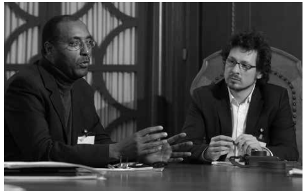
Migranten können als Vermittler, Berater und Experte vor Ort dienen

Das breite Engagement für Herkunfts- wie Aufnahmeland macht Menschen mit Migrationshintergrund zu Partnern der deutschen Entwicklungspolitik. Durch eine stärkere Einbeziehung von Migranten und deren Organisationen vor Ort kann dieses Engagement auch in der Kommunalen Entwicklungspolitik verstärkt genutzt werden.