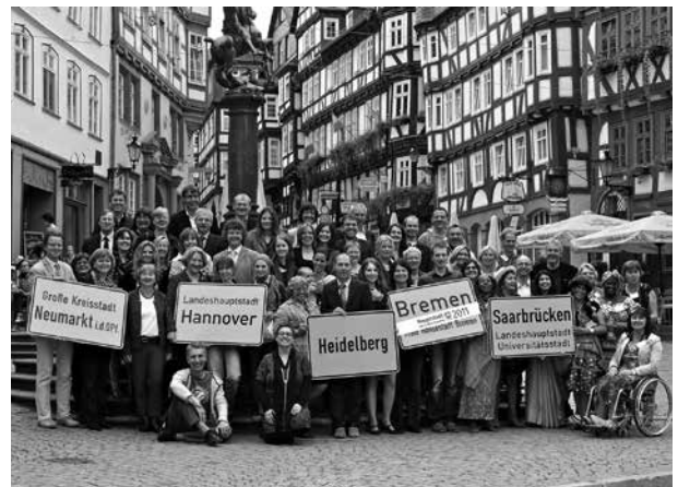
Der Wettbewerb „Hauptstadt des Fairen Handels“ ist ein Motor für faire Beschaffung und Handel vor Ort

SKEW: Wie wirkt sich die Auszeichnung „Hauptstadt des Fairen Handels“ auf das Image einer Stadt oder Gemeinde aus?