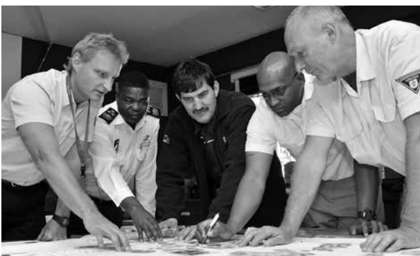
WM-Experten aus deutschen Städten berieten ihre Kollegen in Südafrika

Im Rahmen des Projektes waren insgesamt mehr als 70 deutsche WM-Experten aus 13 Städten knapp 200 Mal in Südafrika. Die Beratungen erfolgten immer bedarfsorientiert, was auf Seiten der Projektplanung höchste Flexibilität erforderte. Entscheidend war der Ansatz einer Beratung auf Augenhöhe, was wiederum viel Fingerspitzengefühl und den reflektierten Umgang mit der Beraterrolle seitens der Fachkräfte voraussetzte. Auch interkulturelle Kompetenzen waren gefordert. Dazu konnten sich die Fachkräfte in der Vorbereitungsstätte für Entwicklungszusammenarbeit (heute AIZ der GIZ) vorbereiten.