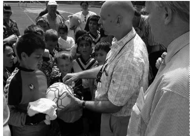
Auch kleine Aktionen wie die Beschaffung von fair gehandelten Fußballen haben große Wirkung

Die Verankerung eines fairen Beschaffungswesens in der Kommune ist nicht von heute auf morgen möglich. Je nach Größe einer Stadt oder Gemeinde und je nach Stand des Nachhaltigkeitsmanagements ist zwischen einer Strategie der kleinen oder großen Schritte hin zur Fairen Beschaffung zu wählen.