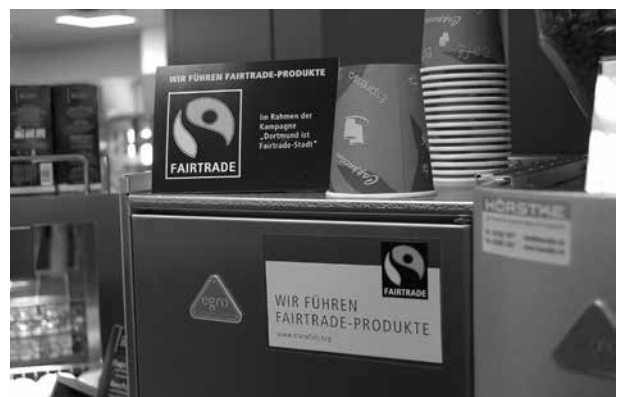
Immer mehr Kommunen gehen mit gutem Beispiel voran und bieten in ihren Rathauskantinen fair gehandelte Speisen und Getränke an

Damit aus kommunalem „Einkauf“ eine „Faire Beschaffung“ wird, können verschiedene Kriterien ganz oder teilweise bei den kommunalen Ausschreibungen berücksichtigt werden. Als wesentlichstes Kriterium gilt die Einhaltung der sogenannten ILO-Kernarbeitsnormen . 28 Basierend auf den vier Grundprinzipien der Internationalen Arbeitsorganisation (International Labour Organisation/ILO) „Vereinigungsfreiheit und Recht auf Kollektivverhandlungen“, „Beseitigung von Zwangsarbeit“, „Abschaffung der Kinderarbeit“ und „Verbot der Diskriminierung in Beschäftigung und Beruf“ sind acht Übereinkommen getroffen worden, die als Kernarbeitsnormen bezeichnet werden: