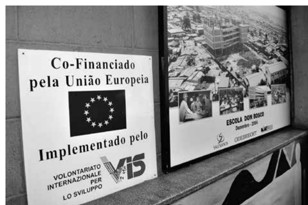
Die Europäische Union fördert über eine Reihe von Förderprogrammen auch Projekte der Kommunalen Entwicklungspolitik

ausgerichtet sind 53 , die Entwicklungspolitik der Städte, Gemeinden und Regionen. Die Schwerpunkte der EU-Förderung liegen in den Bereichen Verwaltungsreform, Wirtschaftsförderung, nachhaltige Gesundheits- und Sozialversorgung, Städteplanung und Umwelt. Die Förderung stellt dabei stets eine Ko-Finanzierung dar, durch die 50 bis maximal 75 Prozent der Projektkosten gedeckt werden.