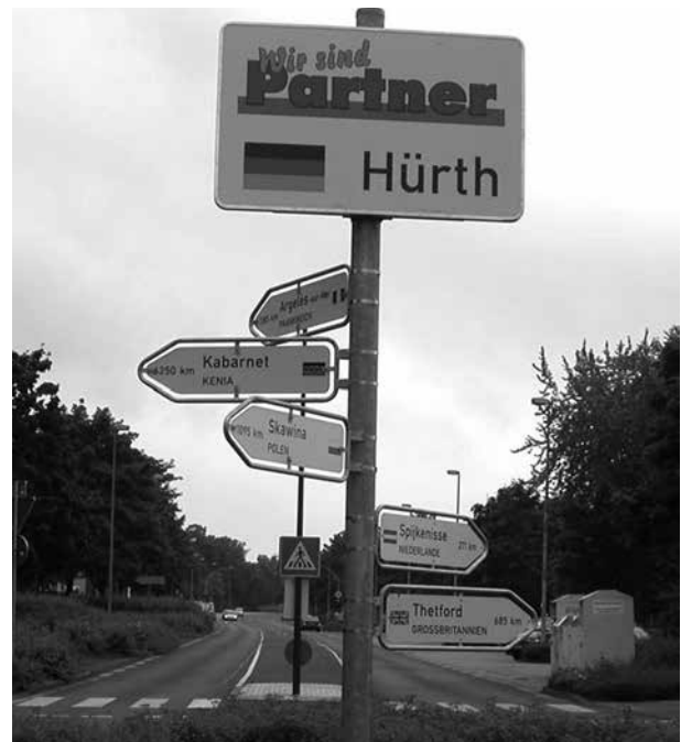
Wie die Stadt Hürth verfügen viele deutsche Kommunen über mehrere Partnerkommunen in West, Ost und Süd - Foto: Barbara Baltsch

Im Hinblick auf die gewaltigen, globalen Herausforderungen wollen deutsche Städte und Gemeinden vermehrt zusammen mit Kommunen aus dem Ausland Lösungsstrategien für gemeinsame Probleme entwickeln, etwa in Fragen des Klimawandels, der wachsenden Armut oder in verschiedenen Bereichen der nachhaltigen Stadtentwicklung. Eine der besten Möglichkeiten hierfür bieten kommunale Partnerschaften.