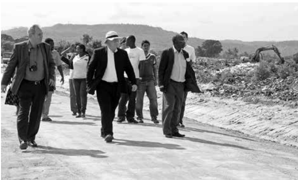
Ein großer Nutzen von Kommunalen Entwicklungspolitik liegt im gegenseitigen Lernen und dem Erfahrungsaustausch in Partnerschaften

Die Kommunen spielen eine besondere Rolle an der Schnittstelle zwischen öffentlichem und privatem zivilgesellschaftlichem Engagement. Die Kommunale Entwicklungspolitik bietet dabei vielfältige Potenziale und Vorteile gegenüber der Entwicklungspolitik von Bund und Ländern. Den Mehrwert kommunaler Entwicklungspolitik sehen Kommunen selbst vor allem in der Bewusstseinsbildung der eigenen Bevölkerung für globale Zusammenhänge, dem eigenen Beitrag zur Bewältigung globaler Herausforderungen und im gegenseitigen Lernen durch Erfahrungsaustausch in Partnerschaften. 17