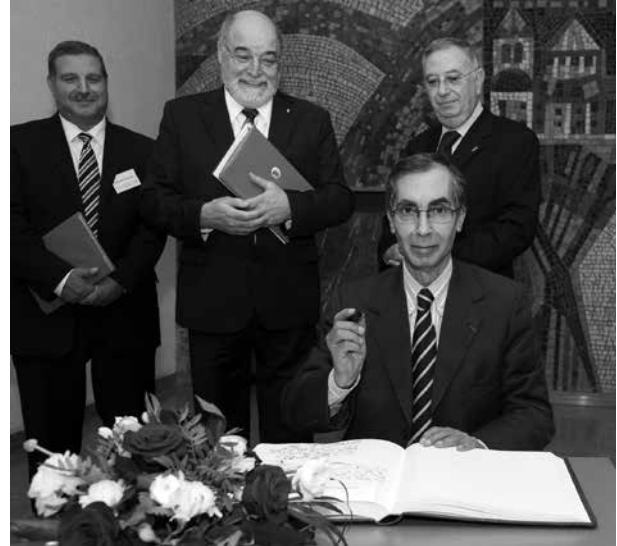
Kommunale Partnerschaften werden häufig durch eine konkrete Partnerschaftvereinbarung, eine Erklärung oder einen Vertrag geschlossen

bestehende Partnerschaft einzubringen und eine Regional-kooperation zu bilden.