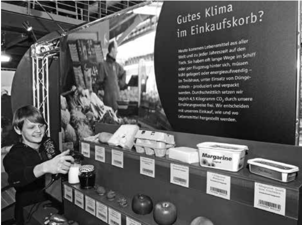
In der Ausstellung „Klimawerkstatt“ der Deutschen Bundesstiftung Umwelt weisen die Handscanner nicht den Preis, sondern den Kohlendioxid-Gehalt der Lebensmittel aus

Globales Lernen als Teil der BNE soll Schülerinnen und Schülern eine zukunftsorientierte Orientierung in der zunehmend globalisierten Welt ermöglichen, die sie im Rahmen lebenslangen Lernens weiter ausbauen können. Unter dem Leitbild nachhaltiger Entwicklung zielt sie insbesondere auf grundlegende Kompetenzen für eine entsprechende