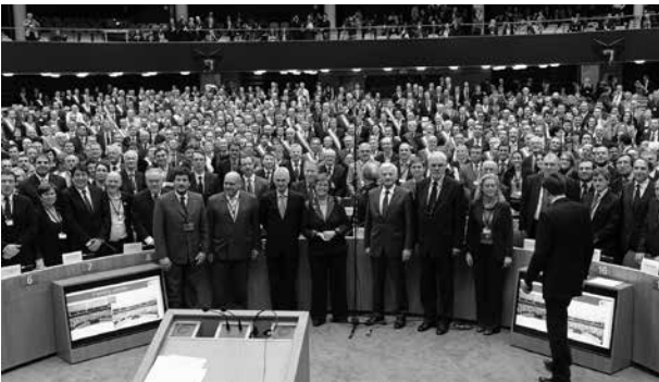
Im Konvent der Bürgermeister engagieren sich europäische Städte und Gemeinden für den Klimaschutz

Die zunehmende Bedeutung der Kommunen als Partner in der internationalen Politik spiegelt sich in der Vielzahl der internationalen Netzwerke und Vereinigungen wider, die die Interessen der lokalen Gebietskörperschaften weltweit oder kontinental vertreten. Gemeinsam entwickeln sie Lösungsansätze, um den Herausforderungen der Zukunft wie Klimawandel, Armut und nachhaltiger Stadtentwicklung angemessen zu begegnen.