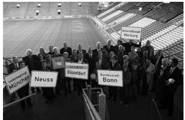
Die Servicestelle Kommunen in der Einen Welt vergibt seit 2003 alle zwei Jahre den Titel „Hauptstadt des Fairen Handels“