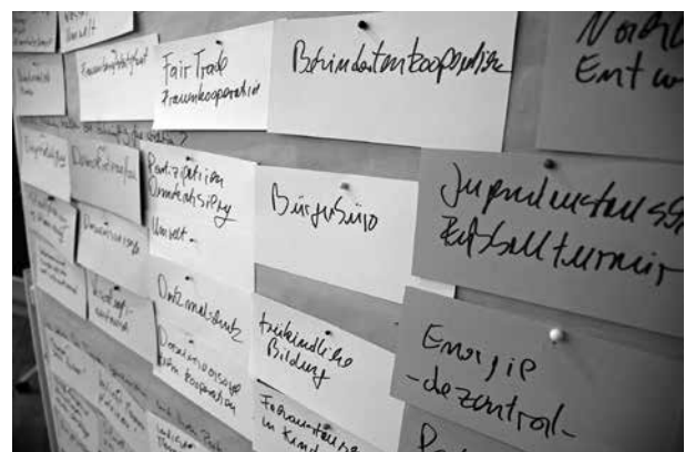
Das Handlungsfeld der Kommunen in der Entwicklungspolitik ist breit gefächert

Die Liste der Handlungsfelder ist Spiegel ihrer Zeit. Mit neuen globalen Herausforderungen werden auch in Zukunft neue Ansätze der Kommunalen Entwicklungspolitik entstehen.