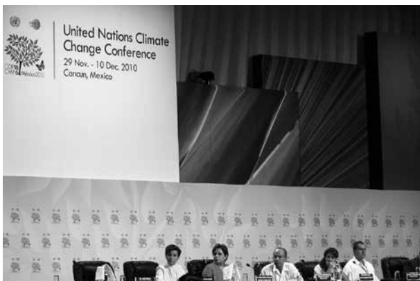
Bei der UN-Weltklimakonferenz Ende 2009 in Cancún wurden die Kommunen als zentrale Akteure bei der Anpassung an den Klimawandel bezeichnet

Entwicklungspolitik für die Kommunen: „Dem Beitrag der Kommunen für die Partnerschaft mit Entwicklungsländern messen die Länder eine große Bedeutung zu. Dies gilt insbesondere für Kultur- und Bildungsarbeit, für die Kooperation mit Migrantinnen und Migranten aus Entwicklungsländern, für gute Regierungsführung und Dezentralisierung sowie für ‚capacity building‘ im Bereich kommunaler Aufgaben.“