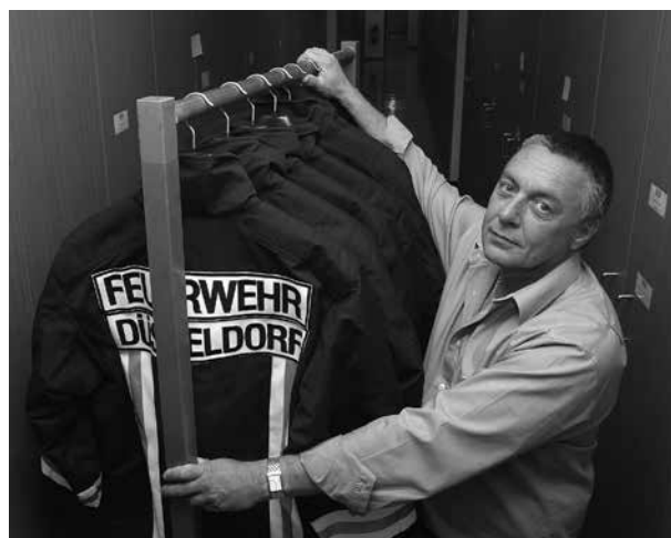
Bereits im Jahr 2001 stieg die Feuerwehr der Stadt Düsseldorf auf fair gehandelte Dienstkleidung um

Wenn ein öffentlicher Auftraggeber Kaffee oder Obst aus Fairem Handel beschaffen möchte, kann er in den Vertrags-erfüllungsklauseln des Beschaffungsauftrags von Lieferanten verlangen, dass dieser den Erzeugern einen Preis zahlt, der ihre Kosten für nachhaltige Erzeugung deckt. Dazu gehören etwa angemessene Löhne und menschenwürdige Arbeitsbedingungen sowie umweltfreundliche Produktionsmethoden.