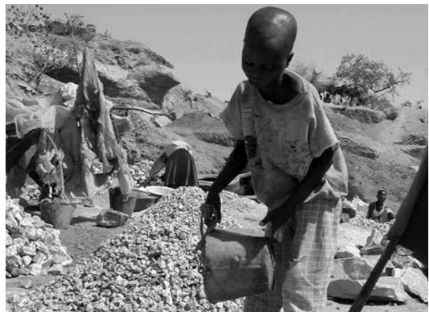
Mit ihrem Verbot von Natur- und Grabsteinen aus ausbeuterischer Kinderarbeit auf Friedhöfen ist die Stadt Saarbrücken Vorreiter

Mittlerweile stammen 80 Prozent der in Deutschland verkauften Grab- und Natursteine aus Indien, China und Vietnam. Der Grund: Viele regionale Steinbrüche sind aus ökologischen Gründen stillgelegt und die Steine aus Asien sind billig zu haben. In den Steinbrüchen Indiens, Chinas oder Vietnams herrschen Arbeitsbedingungen, die weit unter den europäischen Standards liegen. Auch viele Kinder arbeiten dort unter schwersten Bedingungen mindestens zwölf Stunden am Tag und gegen wenig Bezahlung, oft auch ganz ohne Lohn. Die Lebenserwartung liegt bei rund 38 Jahren.