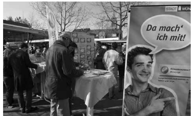
Die Stadt Münster wirbt an Infoständen in den Stadtteilen für den Bürgerhaushalt

Das Verfahren des Bürgerhaushaltes, so wie es in Deutschland seit 1998 praktiziert wird, basiert auf drei Schritten: Information, Konsultation und Rechenschaft . In der Informationsphase werden Einnahmen und Ausgaben des öffentlichen Haushalts in Broschüren, Versammlungen oder via Internet erläutert. Im zweiten Schritt der Konsultation werden im Rahmen von Bürgerversammlungen, Umfragen oder Internet-Diskussionen Anregungen gesammelt. Die Rechenschaft über den Prozess des Bürgerhaushalts sowie die aufgegriffenen oder nicht umgesetzten Vorschläge seitens der Verwaltung erfolgt abschließend im dritten Schritt. Das Modell der Konsultation zu öffentlichen Finanzen ist derzeit das typische Kennzeichen des deutschen Bürgerhaushalts .