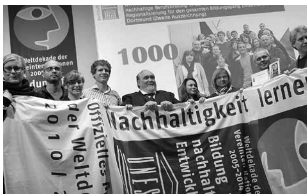
Bereits im März 2010 zeichnete die Deutsche UNESCO-Kommission mit dem Karl-Schiller-Berufskolleg Dortmund das 1.000. UN-Dekade-Projekt in Deutschland aus

Als politischer Orientierungsrahmen dient das Leitbild einer nachhaltigen Entwicklung wie es auf der Umweltkonferenz von Rio de Janeiro 1992 in der „Agenda 21“ formuliert wurde. 63 Dieses Leitbild steht „gleichermaßen für wirtschaftliche Leistungsfähigkeit, soziale Gerechtigkeit, ökologische Tragfähigkeit und gute Regierungsführung“ 64 . Die Geltung des Leitbildes wurde von der Weltgemeinschaft zuletzt anlässlich der Rio+20-Konferenz in Rio de Janeiro im Juni 2012 bekräftigt. Als zentrale weltgesellschaftliche Aufgaben stehen die Bewahrung der natürlichen Lebensgrundlagen und der Abbau der sozialen Ungleichgewichte zwischen Reich und Arm im Vordergrund sowie insbesondere die Beschlüsse zur UN-Dekade für nachhaltige Entwicklung (2005 bis 2014) und der entsprechende deutsche Aktionsplan.