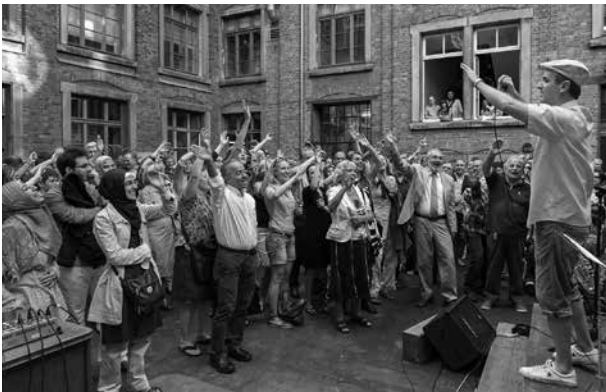
Mit einem großen Eröffnungsfest ist am 24. Juli 2012 in Heidelberg das „Interkulturelle Zentrum in Gründung (IZiG)“ eröffnet worden

Im Rahmen der Konzeptstudie der Stadt Heidelberg wurde eine Umfrage mit über 60 Migrantenorganisationen in Heidelberg durchgeführt. 84 Prozent der Befragten formulierten einen Bedarf an Räumlichkeiten. Darüber hinaus wurden acht interkulturelle Zentren im deutschsprachigen Raum kontaktiert und ihre unterschiedlichen inhaltlichen und formalen Ansätze hinsichtlich Leistungsangebot, Trägerschaft, Struktur und Finanzierung ausgewertet. Die Erarbeitung und Diskussion von konkreten Realisierungsvarianten räumlicher und finanzieller Art ist ein zentraler Teil der Studie. Von einer Komplett-Realisierung über die Anmietung oder den Kauf einer kleinen Immobilie als Zwischenlösung bis hin zu einer Nutzbarmachung bereits vorhandener Räumlichkeiten wurde vieles durchdacht, wobei die Zwischenlösung, welche die Miete eines größeren Objekts beinhaltet (als „Variante 2b“ bezeichnet), präferiert wurde. Diese Variante konnte mit einem überschaubaren Finanzbedarf kurzfristig umgesetzt werden. Das mittelfristige Ziel ist der Bau oder Kauf einer Immobilie, die den Bedarf an Räumlichkeiten vollständig abdeckt.