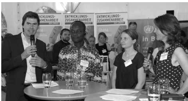
Im Rahmen des Projektes „50 Kommunale Klimapartnerschaften bis 2015“ tauschen sich deutsche und afrikanische Kommunen im Bereich Klimaschutz und Klimaanpassung aus

rungsführung und dezentrale Steuerung schaffen Sicherheit und Entwicklung.