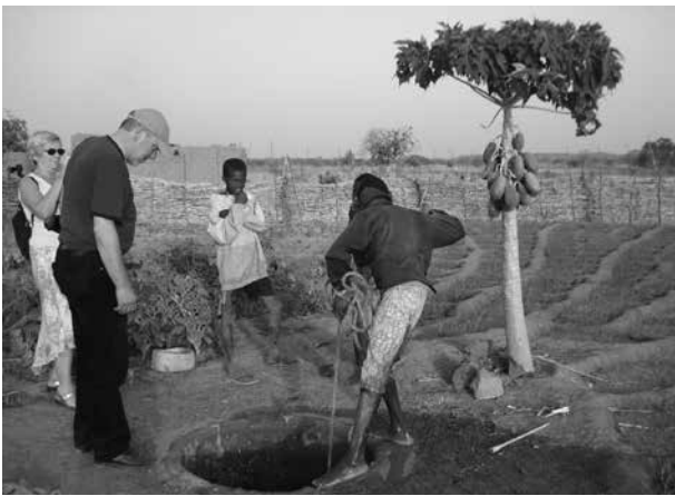
Die nordrhein-westfälische Stadt Würselen engagiert sich mit dem französischen Morlaix im Rahmen einer Dreieckspartnerschaft in der afrikanischen Stadt Rêo

ab (s. Kapitel 2.4). So entwickeln sich zunehmend Dreieckspartnerschaften zwischen Kommunen aus verschiedenen Ländern. Immer häufiger laden deutsche Kommunen auch eine oder mehrere ihrer Partnerkommunen zu themenbezogenen Konferenzen ein, aus denen sich Ringpartnerschaften oder themengeleitete Netzwerke entwickeln, die einen Austausch auf hohem fachlichem Niveau darstellen.