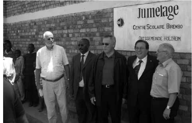
Im Rahmen der Länderpartnerschaft zwischen Rheinland-Pfalz und Ruanda hat auch die Ortsgemeinde Holzheim eine Partnerschaft geschlossen

Qualitätsorientierung oder einem gemeinsamen Projektmanagement begleitet.