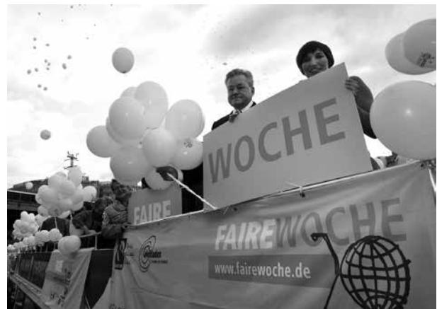
Im Rahmen der jährlich stattfindenden Fairen Woche wird auf die Bedeutung des Fairen Handels aufmerksam gemacht

Faire Beschaffung heißt nachhaltige Beschaffung. Sie berücksichtigt soziale, ethische und ökologische Nachhaltigkeitskriterien bei der Herstellung und im Handel von Waren und Dienstleistungen – angefangen bei der Produktentwicklung und Rohstoffgewinnung über die Produktion bis hin zum Transport der Güter. Nur wenn diese nachhaltige Wertschöpfungskette berücksichtigt wird, ist von einer Balance der ökonomischen, ökologischen und sozialen Gewichte auszugehen.