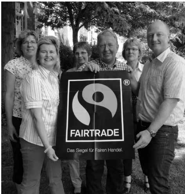
Das von der unabhängigen Initiative TransFair e. V. vergebene Fairtrade-Siegel ist mittlerweile ein Markenzeichen für fair gehandelte Produkte

Die Stadt Düsseldorf verzichtet bei der Beschaffung nicht nur auf Produkte aus ausbeuterischer Kinderarbeit, sondern fordert auch die Einhaltung aller acht ILO-Kernarbeitsnormen. Die Liste der fair angeschafften Produkte der Stadt ist lang und reicht von fair produzierter Feuerwehrkleidung, „fairen Uniformen“ des Ordnungs- und Servicedienstes und ILO-gerechter Kleidung für die Mitarbeiter des Gartenamtes über faire Blumen und FSC-zertifiziertes Holz bis hin zu fairen Fußballen. 32