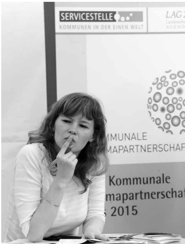
Die Servicestelle Kommunen in der Einen Welt ist das Kompetenzzentrum für entwicklungspolitisch interessierte Kommunen in Deutschland.

Mit zunehmender Etablierung der Kommunalen Entwicklungspolitik ist die Anzahl der Akteure auf allen Ebenen – global bis lokal – stetig gestiegen, so dass die Akteure heute auf eine gewachsene Struktur von Institutionen zugreifen können. Sie gewähren einerseits einen breiten Handlungsspielraum für Vernetzung und Kooperation, fordern andererseits aber ein hohes Maß an kommunikativer Kompetenz und Orientierungsfähigkeit vom Einzelnen, um angesichts der Komplexität der Handlungsfelder Dialoge auf den unterschiedlichsten politischen Ebenen und mit den wechselnden Akteuren zu initialisieren und zu lenken.