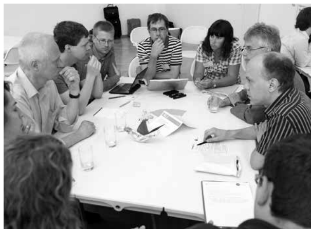
Mit dem Bürgerhaushalt hält eine neue Kultur der Einbeziehung und Beteiligung von Bürgerinnen und Bürger Einzug in die Kommunen

Verwaltungsmitarbeiter erfahren, dass Bürgerbeteiligung der Verwaltung trotz anfänglicher Mehrarbeit nutzt. Durch mehr Entscheidungsklarheit, zunehmende Bürgerzufriedenheit und generelles bürgerliches Empowerment kann ein Bürgerhaushalt die Verwaltung langfristig sogar nachhaltig entlasten. Außerdem hilft der Bürgerhaushalt bei der Modernisierung der Verwaltung, die immer stärker auf themenübergreifende Zusammenarbeit und Lösungsentwicklung zielt.